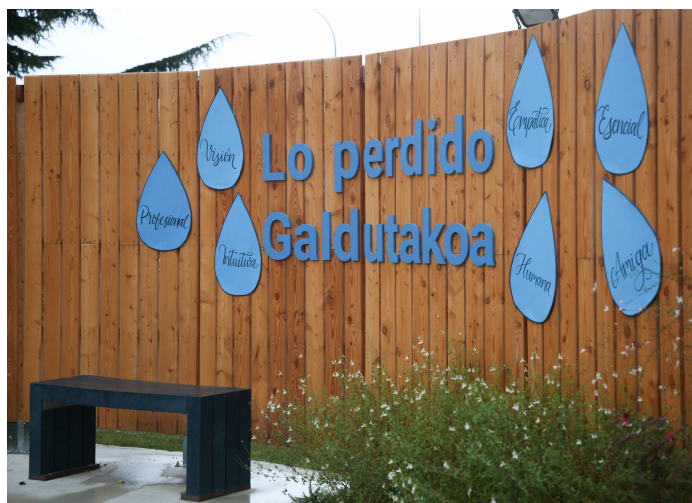
📷 Instalación de recuerdo junto al CHN.