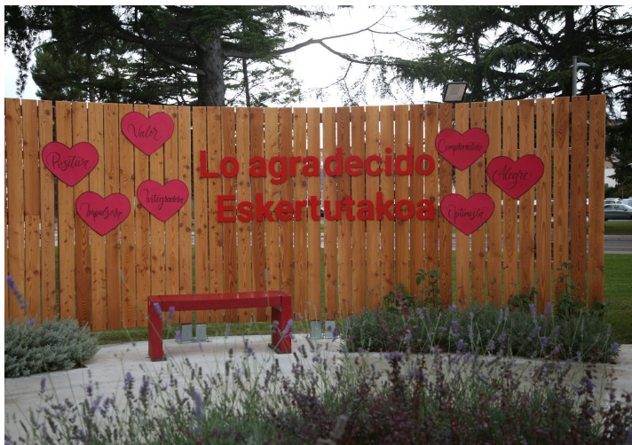
📷 Instalación de recuerdo junto al CHN.