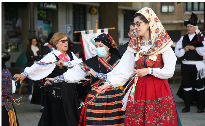
Bailarinas de las casas regionales.