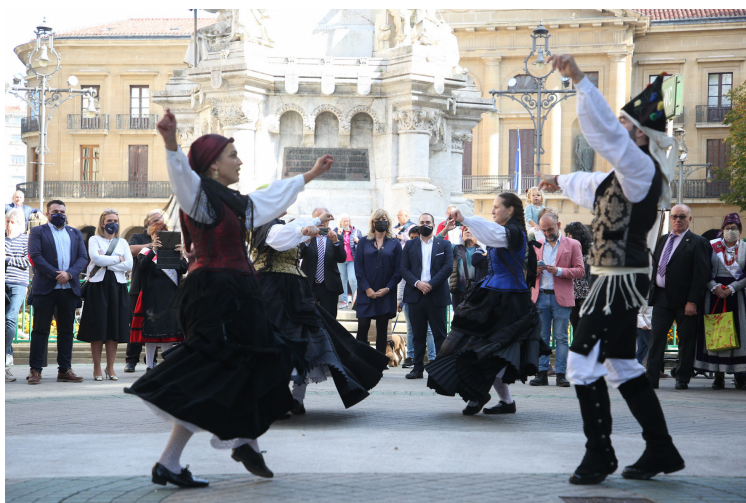
Los grupos de danzas han bailado en el Paseo de Sarasate.