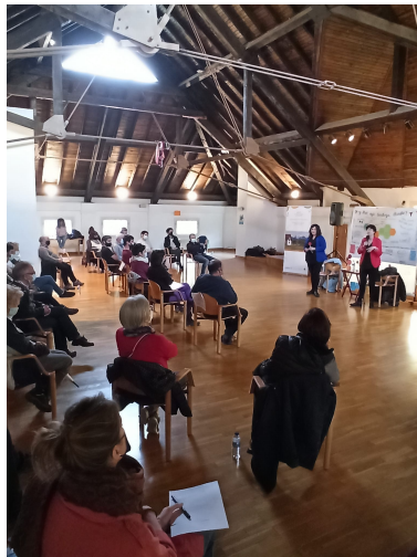
Participantes en el foro "Bortuetako euskalkiak".