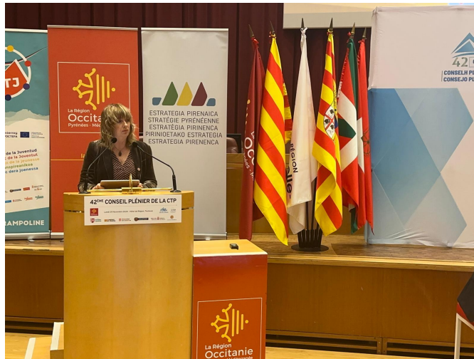
La vicepresidenta Ana Olo, durante su intervención en el plenario de la CTP.