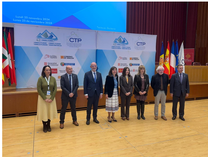
La vicepresidenta Ana Olo con representantes del resto de regiones presentes en el plenario de la CTP.