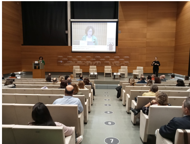
Imagen de Civican durante la jornada.