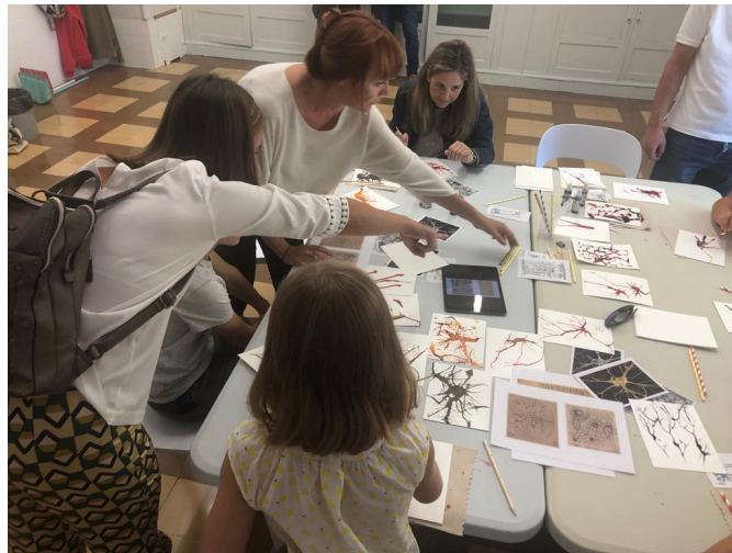
Imagen de la actividad Ciencia Ciudadana con Cajal – Open Science