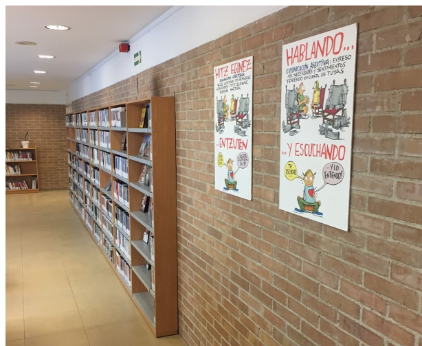
"Hablando y escuchando", en la biblioteca de Zizur Mayor.