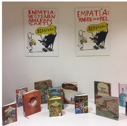
Carteles y libros preparados para la exposición.