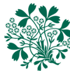
Royal Botanic Garden Edinburgh