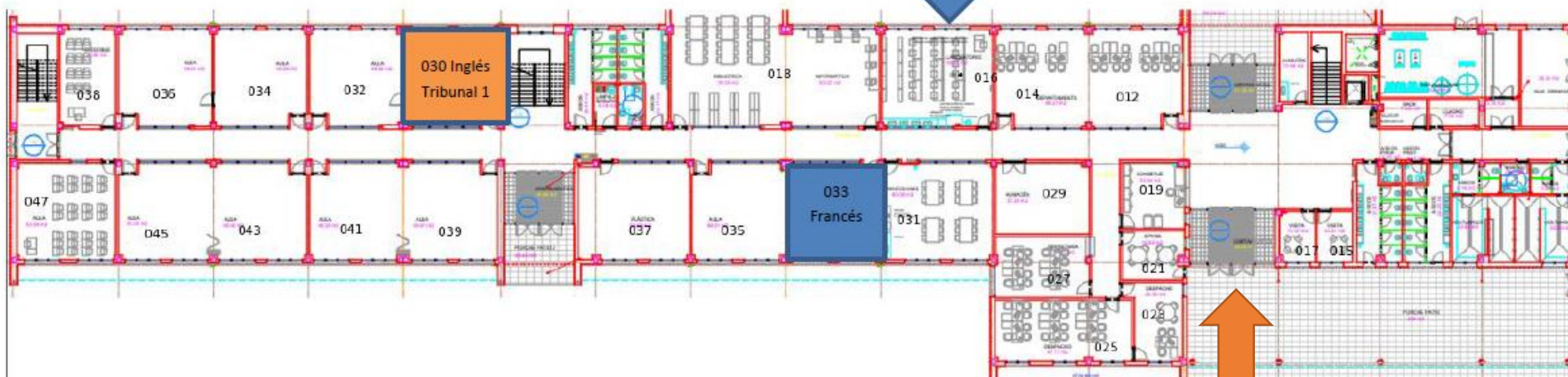
Planta baja / Beheko solairua