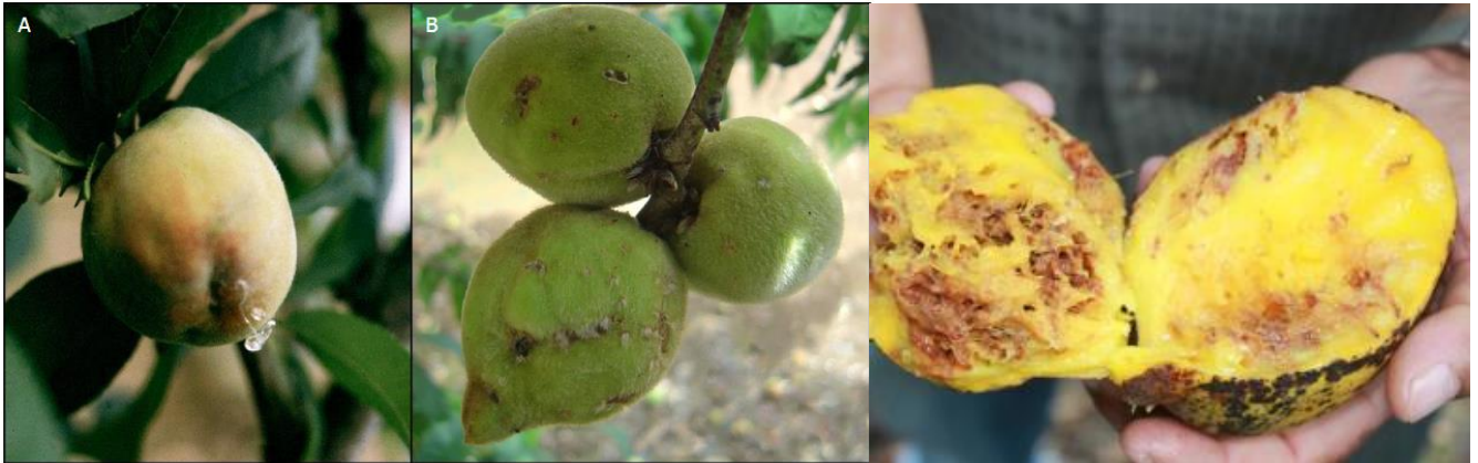
Ilustración 3. Imagen de los exudados en melocotón y resultado de la alimentación de las larvas en mango.

En frutas con mucho jugo exuda fluido por el orificio de oviposición, que puede pasar a color marrón. Las larvas hacen las galerías primero cerca de la oviposición y luego se desplazan hacia el hueso deteriorando el fruto