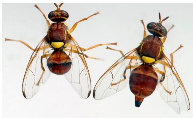
Ilustración 4. Ciclo de la plaga e imagen de dos adultos.