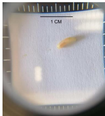
Ilustración 1. Imagen de un adulto (EFSA) y de una larva (EPPO)

Los huevos son alargados y elípticos de una longitud de 1-1,2 mm. Las larvas pasan de unos 2 mm a 4-6,5 mm. La pupa mide 4-6mm largo y unos 2.5mm de ancho (amarillentas o marrón amarillentas). Los adultos mien unos 6 mm de color marrón rojizo.