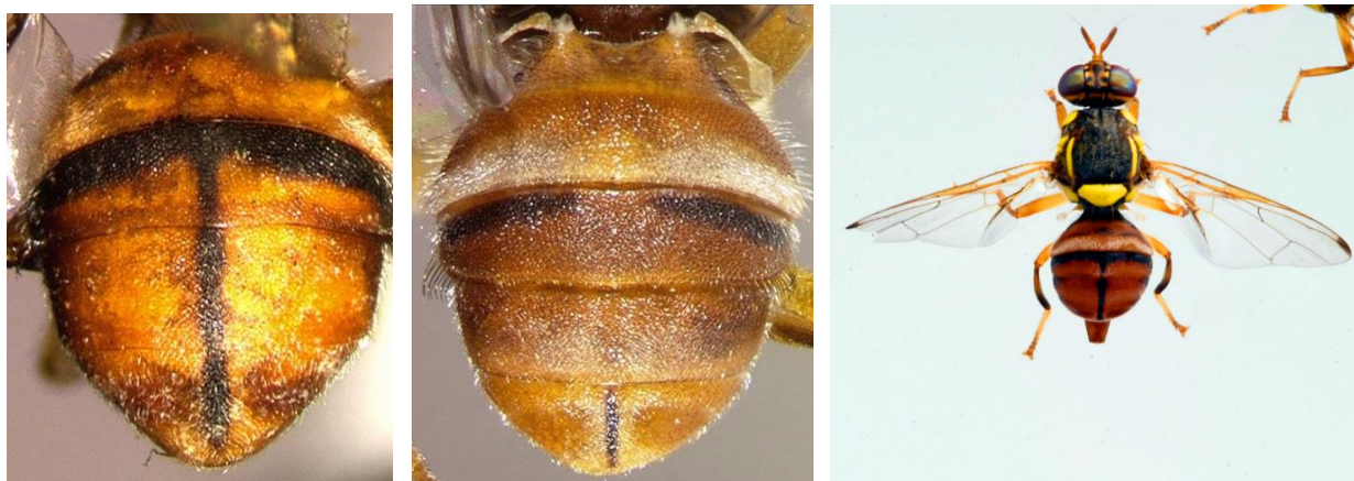
Ilustración 5. Bactrocera dorsalis (izda), B. zonata (dcha) y B. correcta

Se puede confundir con B. correcta , Dacus ciliatus , B. affinis y B. dorsalis (también prioritaria).