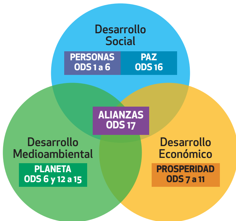
ODS y dimensiones del Desarrollo Sostenible

Movilizar los medios necesarios para implementar esta Agenda mediante una Alianza Mundial para el Desarrollo Sostenible revitalizada, que se base en un espíritu de mayor solidaridad mundial y se centre particularmente en las necesidades de los más pobres y vulnerables, con la colaboración de todos los países, todas las partes interesadas y todas las personas. Esta esfera queda recogida especialmente en el ODS 17; y aún a las tres grandes dimensiones descritas.