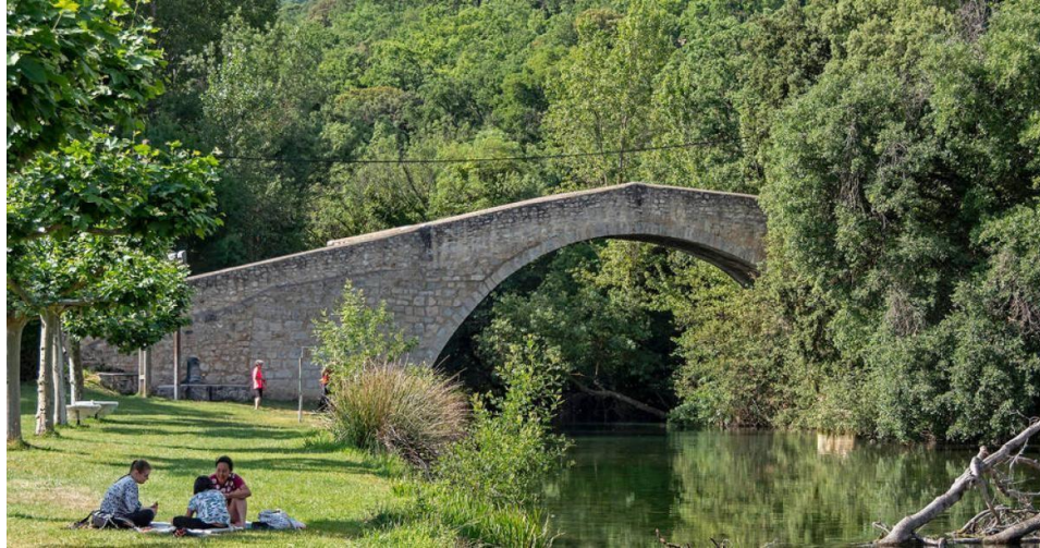
Mota: Ibaia | Kokapena: Allin

Ibai igerilekua urmael bat da, eta presa txiki batek sortu du. Haren ura Urbasa-Andia parke naturaleko mendigune karstikotik dator, Urederraren iturburutik eta “Ega eta Urederra ibaiak” Kontserbazio Bereziko Eremuaren (KBE-ES 2200024) ibai korridoretik, eskuineko ertzean. Bainu-eremu berean zubi erromaniko bat dago, eta bertatik amurrainak ikusi ohi dira; zalantzarik gabe, bertako uren kalitate onaren adierazle da hori.