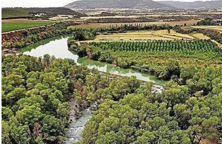
Mota: Ibaia | Kokapena: Zarrakaztelu

Presak batek sortutako bainu-eremua Aragoi ibaian. Ingurune pribilegiatua da, eta zuhaitz handiak ditu. Presak 300 metroko zabalera du, eta ibaiak ura dakarrenean ur ikuskizun polita eskaintzen du. Ebroko Konfederazio Hidrografikoak (CHE) ohartarazi du eremu horretan uraren maila bat-batean aldatzen dela, eta, beraz, arriskutsua dela. Ibilaldi bat egin daiteke Zarrakazteluraino ibaiaren ertzetik, eta ibaiertzeko basoa eta bertan bizi diren hegaztiak ikusi. “El estrecho” deituriko lekuan, bidea amilburu baten azpitik igarotzen da, eta bertan lur jausiak izan ohi dira euria egiten duenean; beraz, kontuz ibili behar da.