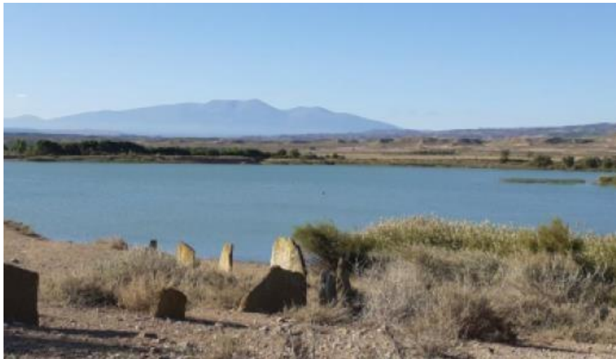
Mota: Idoia | Kokapena: Tuteran

Pulguer idoia Batasuneko garrantziko lekua (BGL) eta natura erreserba da 1987tik. Nafarroako hegoaldean dagoen bainu-eremua da, eta klima idorra du nagusiki. Hezegune oso garrantzitsua da hegaztientzat; zehazki, zikoinen etzaleku nagusia da Nafarroan. 1627an sortu zen, ureztatzeko idoia eraiki zenean. Udan uraren tenperatura 22 eta 26 °C artekoa da. Gazitasun ertain-altua du. Buia batzuek mugatzen dute uretako kirolak egiteko eremua. Leku ezin hobea da naturarekin kontaktuan egoteko, uretan sartu-irten bat egiteko, igeri egiteko edo kayaketan edo windsurfetan nabigatzeko, adibidez.