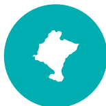
5.000 bizt. baino gutxiagoko udalerrriak