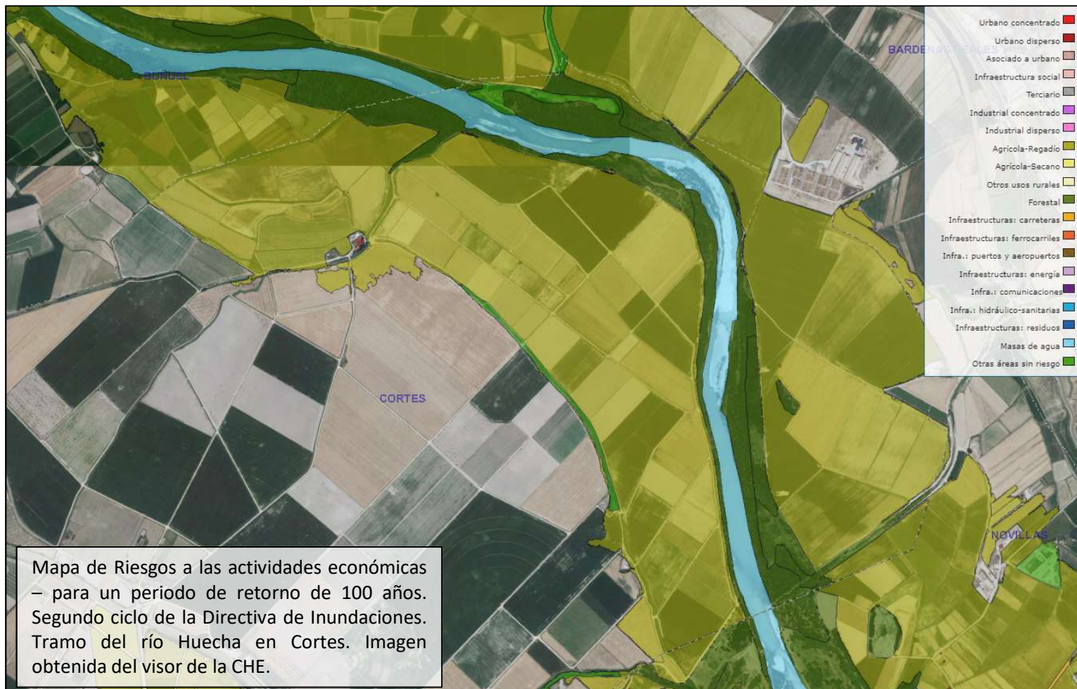
Mapa de Riesgos a las actividades económicas – para un periodo de retorno de 100 años. Segundo ciclo de la Directiva de Inundaciones. Tramo del río Huecha en Cortes.

La vuelta a la normalidad y desactivación del plan del Ebro en Cortes se produce cuando los niveles de caudal en los ríos de la cuenca del Cidacos pasan a estar por debajo de los umbrales establecidos para la desactivación del plan, no existe previsión de lluvias importantes en las próximas 48 horas, y no existen zonas afectadas en el casco urbano.