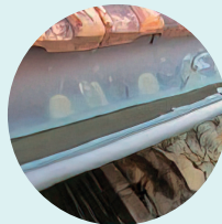
Canalones Teilatuetakako hodiak