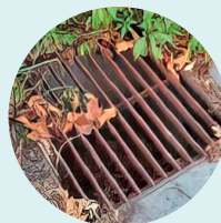
Imbormales, alcantarillas Estolda-zuloak, estoldak