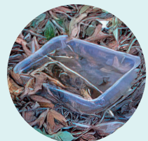
Envases, recipientes Enbaseak, ontziak