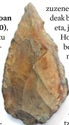
ARANTZADUIKO AURPEGI BIKOA (URBASA)

Neolitoan (K.a. 4.500-2.500) pixkanakako prozesu batean, ehiztari taldeak nekazari komunitate bihurtu ziren. Zenbait belaundiz, bi bizimoduak batera egon ziren bizirik Nafarroan, erregistro arkeologikoak erakusten duen bezala. Gutxikagutxika, aldaketa ekonomiko, sozial eta idelgikoak gertatu ziren. Zereala lantzeko eta animaliak hezteak, aziendak alegia,