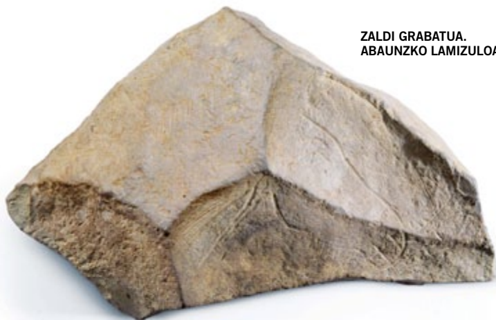
ZALDI GRABATUA. ABAUNZKO LAMIZULOA

Ikusgai dauden beste piezek argi uzten dute Abaunzko biztanleek hezurra erabili zutela eskemak irudikatzeko (eskailera formakoak), baita marfila ere zintzilikario bat egiteko, 7 marka dituen. Segur aski zenbatzeko sistema bat, ilargialdian oinarritua, ilargi-egutegi moduko zer bait.