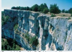
Pared del Capellán