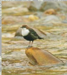
Mirlo acuático

Es destacable la comunidad de aves rupícolas, siendo fácilmente observables buitres, alimoche, halcones, cernicalos, chovas y vencejos. Abundan los passeriformes, como el mirlo acuático, los carboneros, herrerillos y pinzones. No faltan los mamíferos, como el gato montes, la garduña, el tejón o el jabalí.