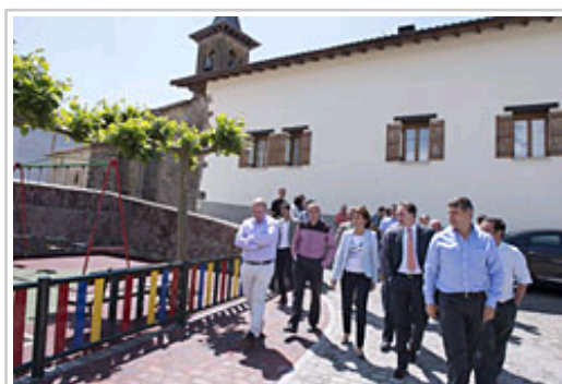
Barcina Lehendakaria gainerako agintariekin zolatu berri diren kaleetan zehar

Plazarako eta elizaren eta frontoiaren ingururako hormigoizko galtzada-harri prefabrikatudun bide-zorua erabili da, eremua nagusiki