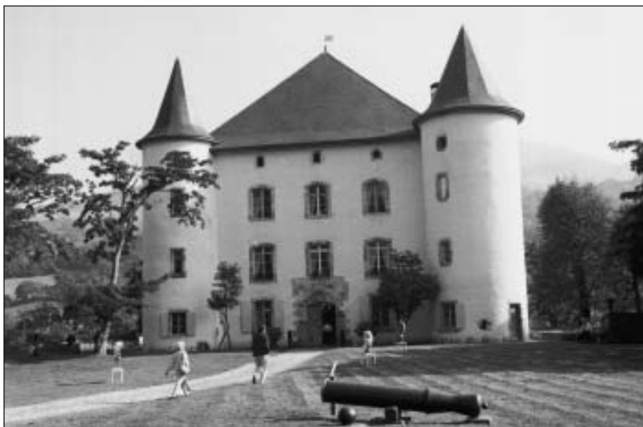
Foto 5: El castillo de Echaz en St-Étienne-de-Baïgorry, el día de la inauguración de la exposición “La vie et les traditions de la Navarre” (septiembre de 2000)