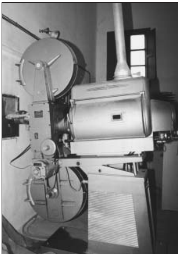
Foto 3: El proyector Hispania Radio (1963) en el cuarto de proyecciones del cine Alesves, en Villafranca. Trasladado al Museo Etnológico en 1999