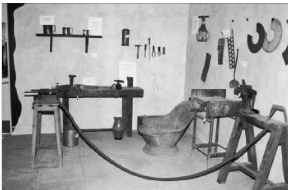
Foto 4: Montaje del taller de hojalatería de Daniel Lizaur en la exposición “Navarra hace 100 años” (Ciudadela de Pamplona, mayo de 1999)