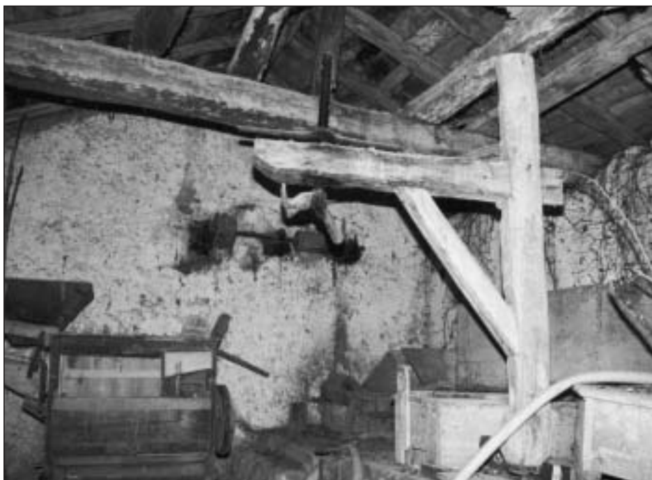
Foto 1: Interior del molino de la Casa Franciscocho, de Nagore, donado y trasladado al Museo Etnológico ante su inminente inundación por el pantano de Itoiz