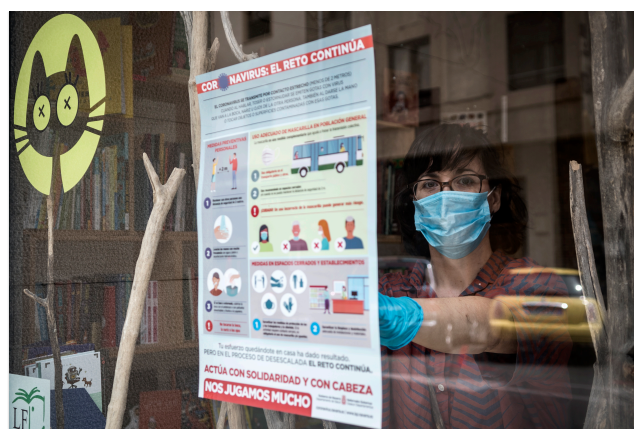
Imagen del cartel en el escaparate de un comercio.

El Instituto de Salud Pública y Laboral de Navarra (ISPLN/NOPLOI) ha iniciado la distribución, entre ayuntamientos y establecimientos de comercio minorista, servicios y hostelería, de carteles y trípticos para informar y concienciar sobre la necesidad de mantener las medidas de prevención frente al COVID-19, durante el proceso de desescalada. Esta información se dirige tanto a la población general navarra como a personas propietarias, trabajadores, trabajadoras y clientela de los establecimientos implicados.