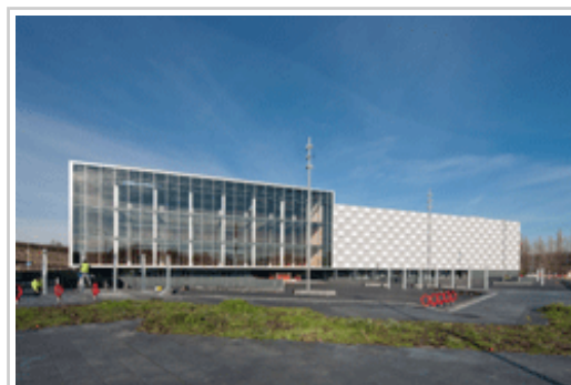
Navarra Arena pabilioiaren kanpoaldea.

2018ko irailean hasiko da Nafarroako Gobernuak Navarra Arena Pabilioia publikoarentzako irekitzen; horrela, irtenbidea emango dio 2013. urteaz geroztik itxita eta erabili ahal izateko oraindik obra beharrean dagoen eta judzialki 4,2 milioi euro erreklamatzeko zaizkion azpiegitura horri.