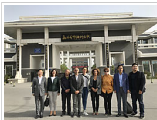
Ambas delegaciones tras las visitas a centros educativos vocacionales.

Como parte de un sistema educativo, la delegación navarra, también ha expuesto en Gansu que la FP está en coordinación con el resto de programas del Departamento de Educación tomando nuevas metodologías y prestando los recursos de atención a la diversidad del alumnado.