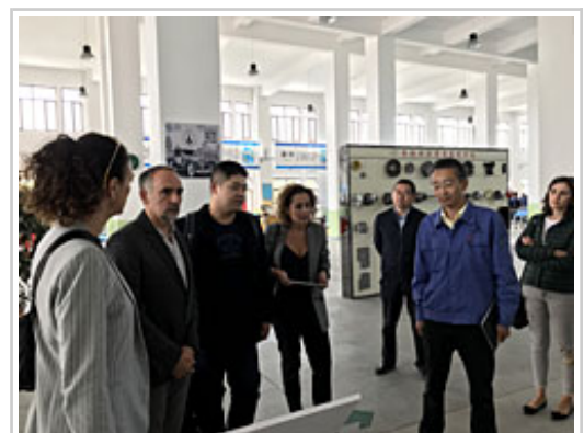
Responsables de Educación en un taller de automoción y mecánica.

En el marco del viaje institucional que el Gobierno de Navarra lidera esta semana en la provincia china de Gansu, la representación del Departamento de Educación se ha entrevistado este jueves con el vicegobernador de Gansu, con quien han concretado colaboraciones en cinco especialidades de formación profesional, de interés para ambas