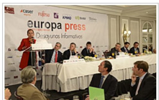
La Presidenta defendió en Madrid el modelo

En su intervención, la Presidenta Barkos ha hecho además una exposición del