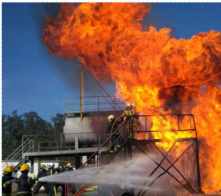
FOTOGRAFÍA PRÁCTICAS BOMBEROS DE NAVARRA