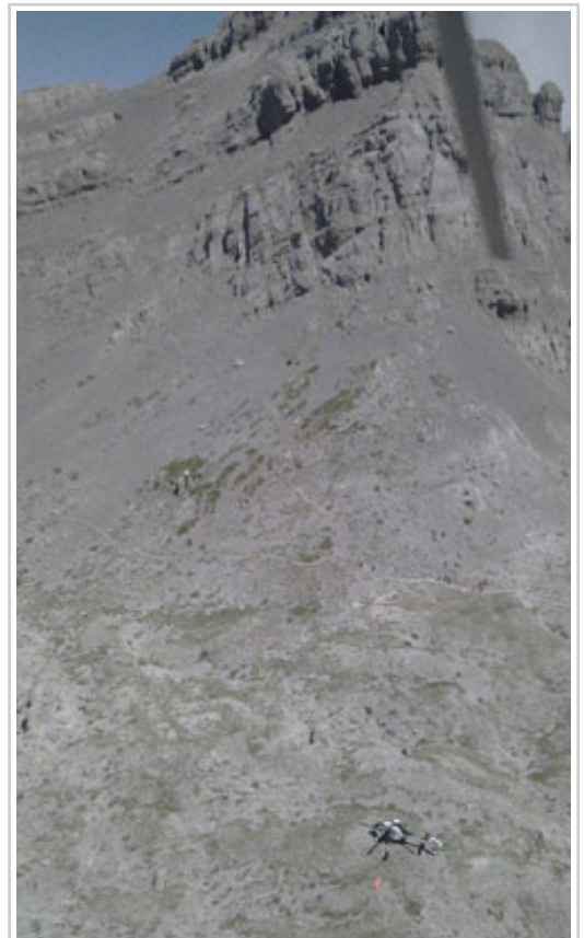
Un helicóptero, posado en la zona donde han sido hallados los cuerpos bajo la cumbre del Anie.

Otros dos helicópteros, uno del Gobierno de Navarra en el que viajaban agentes del GREIM de la Guardia Civil y otro del GREIM de Jaca, han recuperado los cuerpos y los han trasladado hasta el aparcamiento situado en el collado de Ernaz, donde también se encuentra el puesto de mando avanzado de la Agencia Navarra de Emergencias. Allí han sido introducidos en un furgón fúnebre que los llevará hasta el Instituto Navarro de Medicina Legal con el fin de que les sea practicada la autopsia.