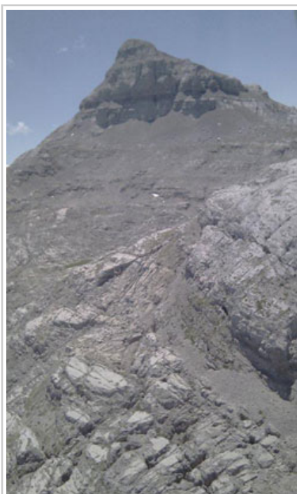
El pico Anie.