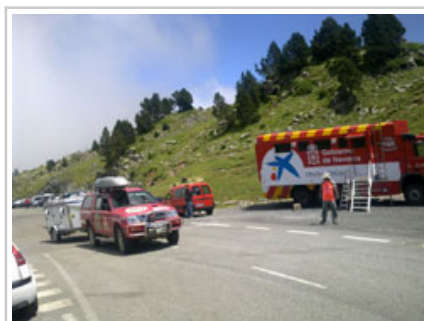
El vehículo de la unidad canina y el puesto de mando avanzado de la ANE, en el collado de Ernaz.