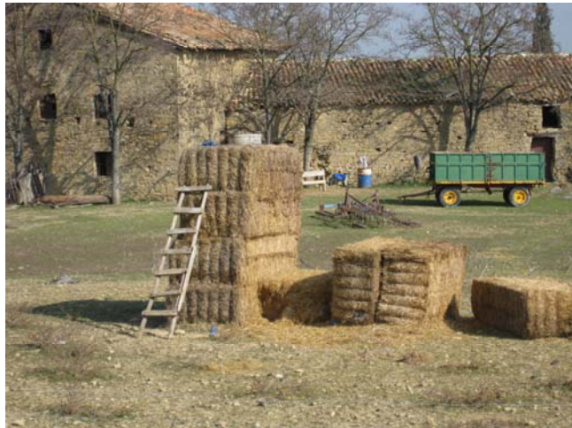
Ejemplo de despropósitos en prevención