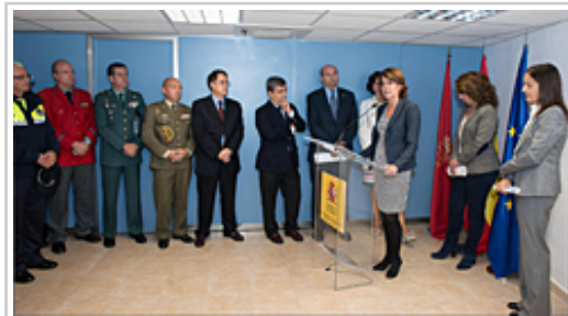
Barcina Lehendakaria bere agerraldian.