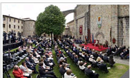
Bertaratutakoak Felipe Printzearen hitzaldia entzuten.