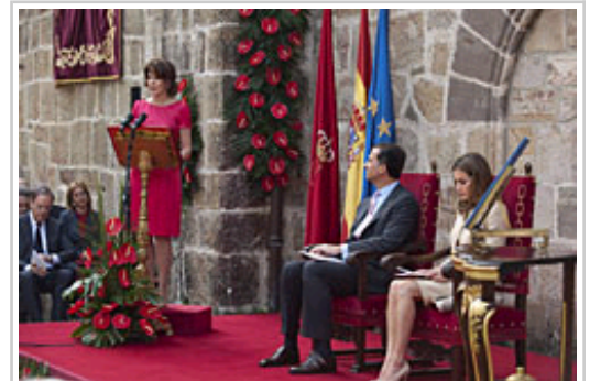
Barcina Lehendakariak egindako agerraldiaren une bat.

(Banaketa-ekitaldia Foru Komunitate guztian ikusi ahal izan da zuzenean Navarra Televisión-ekin