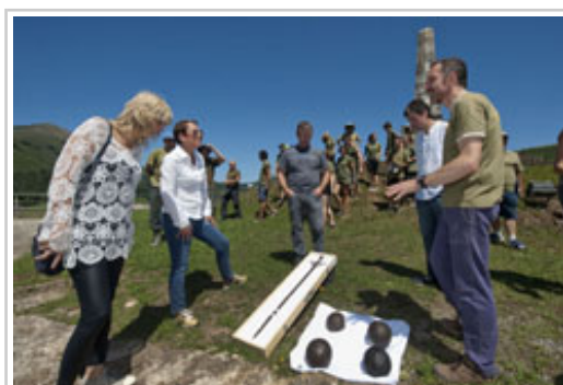
La Presidenta Barkos y la consejera Olo observan una espada y una bala de cañón encontradas en el lugar.

La Presidenta de Navarra, Uxue Barkos, ha visitado hoy el yacimiento musealizado del castillo de Amaiur y ha conocido la marcha de las excavaciones arqueológicas, que precisamente este año cumplen el décimo aniversario de su inicio, y gracias a las cuales se ha conseguido conocer las dimensiones y características que tenía esta edificación militar.