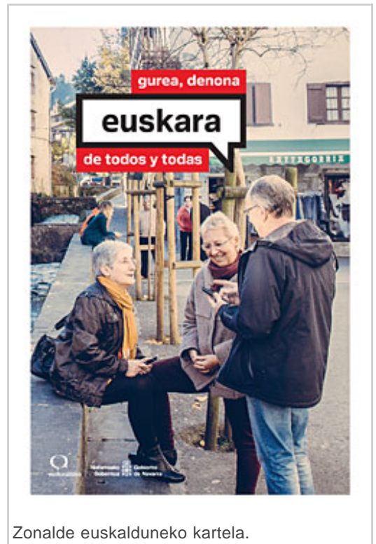
Zonalde euskalduneko kartela.