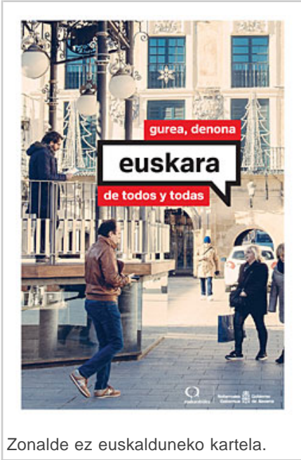
Zonalde ez euskalduneko kartela.