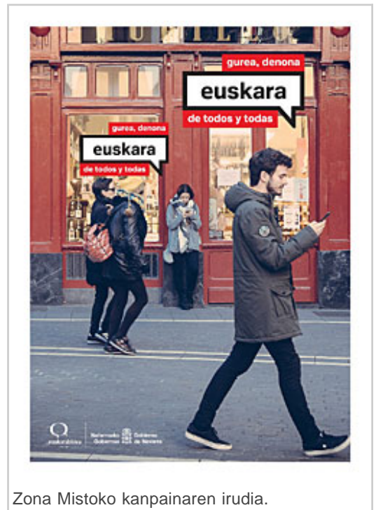
Zona Mistoko kanpainaren irudia.

Kanpainaren lelo nagusia, iaz, euskararen aldeko ekimenaren lehen edizioan, erabilitako bera da: “Euskara gurea, denona / El euskara de todos y todas”, eta euskararen erabileraren egunerokotasuna eta komunikazio digitalaren aroan duen baliagarritasuna erakutsi nahi dira. Horretarako, pertsonen eguneroko lau eszena hautatu dira hizkuntza hori erabiliaz gailu digitaletan; hain zuzen ere, ostalaritzako lokal batean kokatu dira eta Nafarroan, Euskararen Foru Legeak ezarritako hiru zona linguistikotako herrietako hiru eskenatokitan: Lesaka (zona euskalduna), Iruña (zona mistoa) eta Tuteran (zona ez euskalduna).