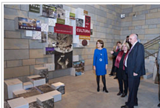
Barcina Lehendakaria Vianako Printzea Institutzioaren 75. urteurrenako aldi baterako erakusketa bisitatu aurretik.

Aldi baterako erakusketak, berriz, honako hauek batzen dituen hamar bat beira-arasa ditu: argitalpenak, osaeraren argazkiak eta piezak, instituzioaren historia eta jardura, eta, haiekin batera, azalpen-testu bat dago. Besteak beste, gogoratzen dira, Aralarko San Migelgo