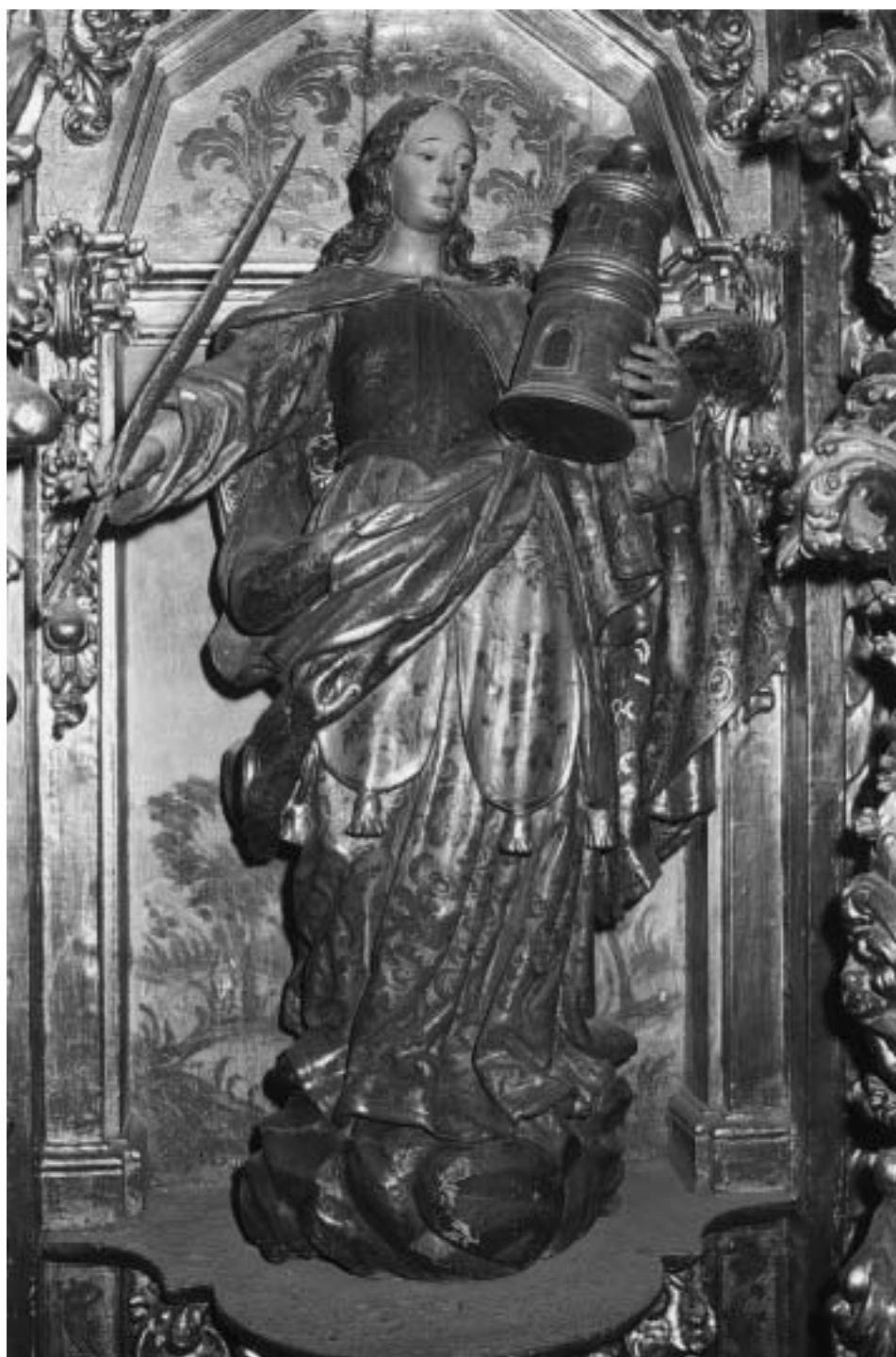
Santa Bárbara, por Francisco Barona. Año 1720