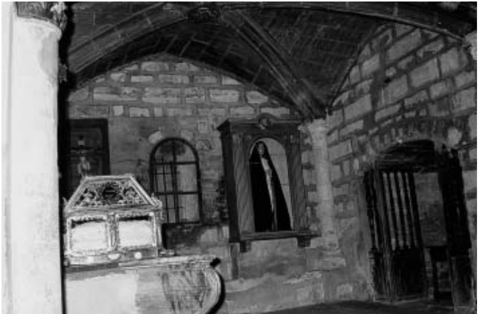
Capilla de las imágenes de la Pasión, por Bartolomé Lamaza. Año 1693