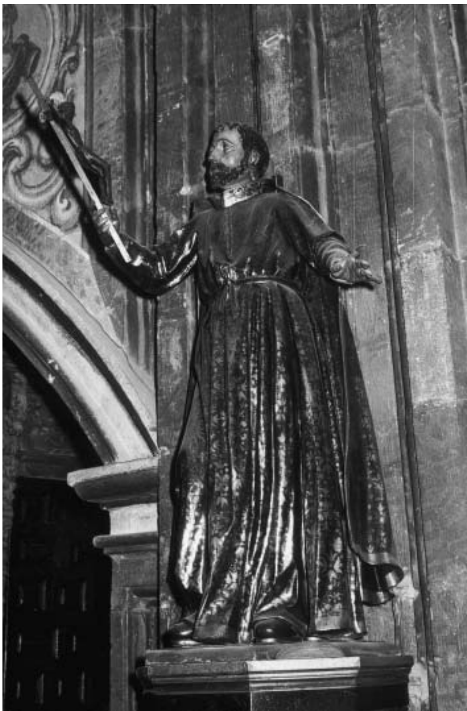
San Francisco Javier, por Francisco Ximénez. Año 1704