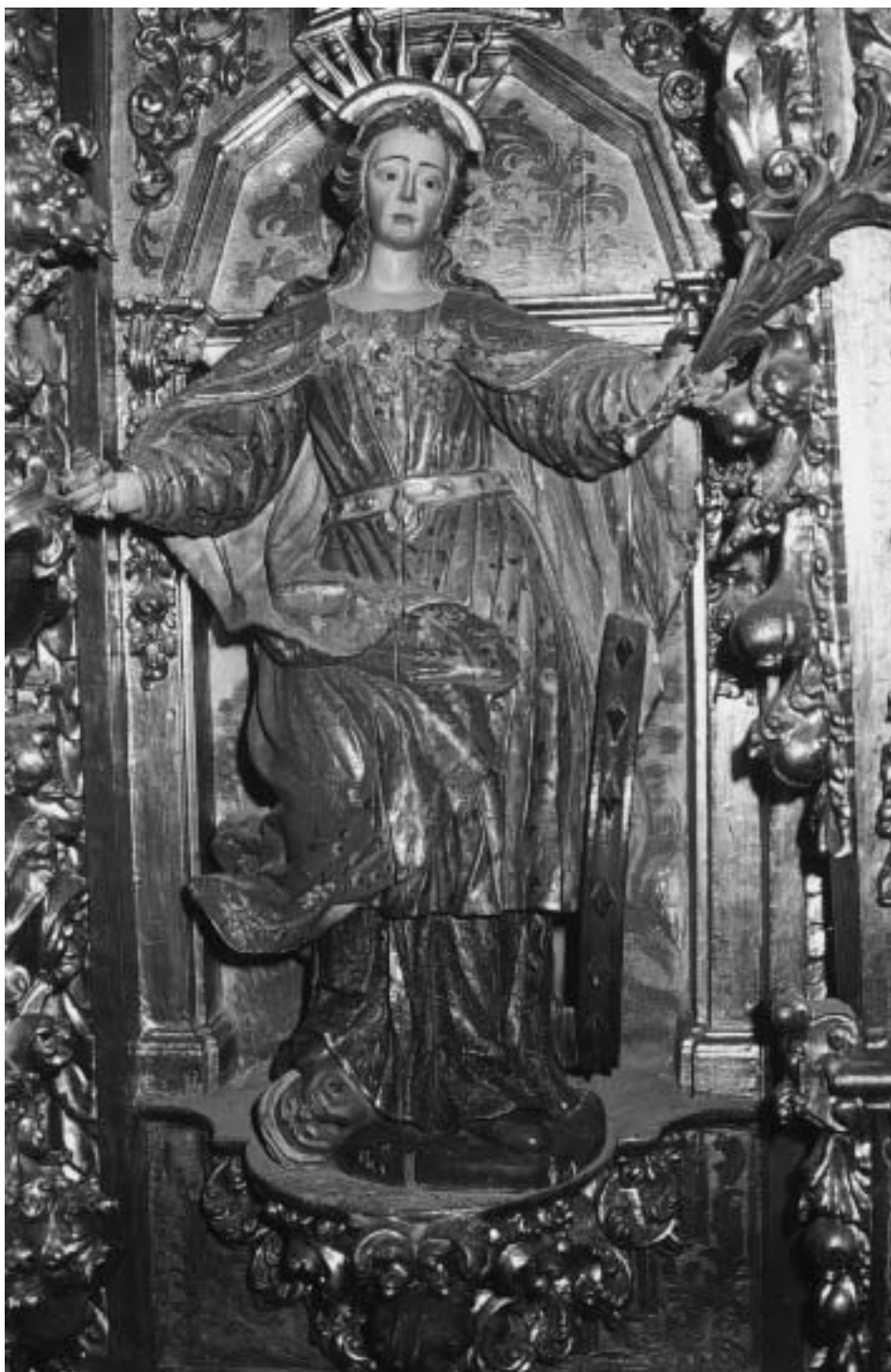
Santa Catalina, por Diego de Camporredondo. Año 1760