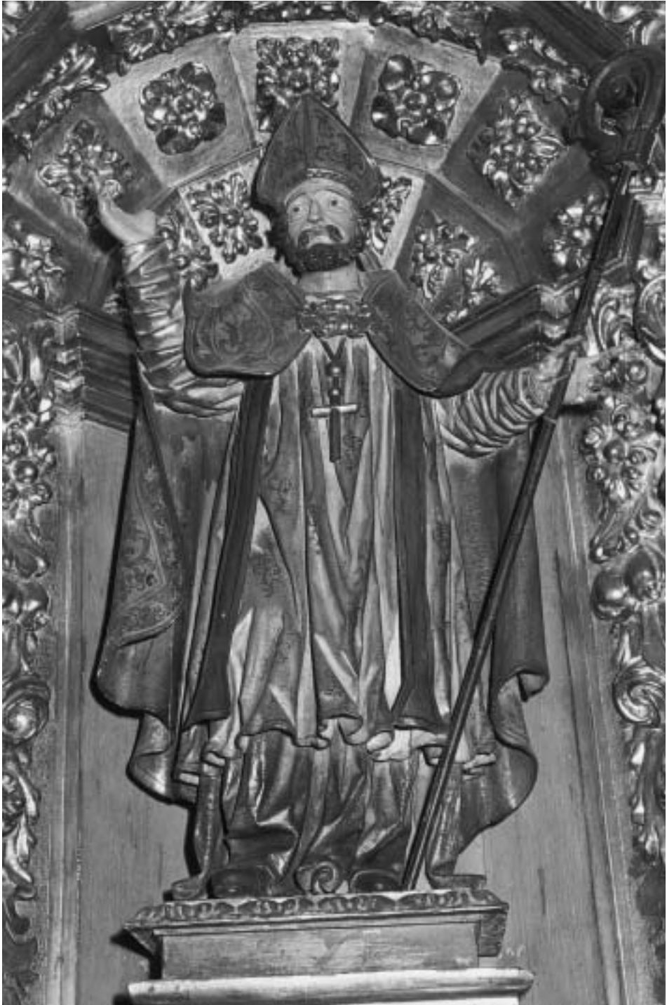
San Gregorio Ostiense, por Francisco Ximénez. Año 1690