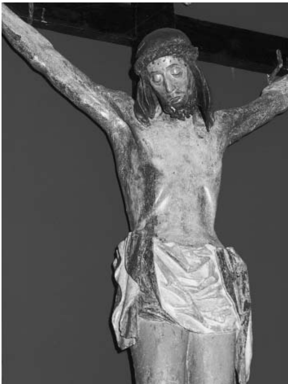
Cristo de las Enaguillas o del Miserere (siglo XVI)