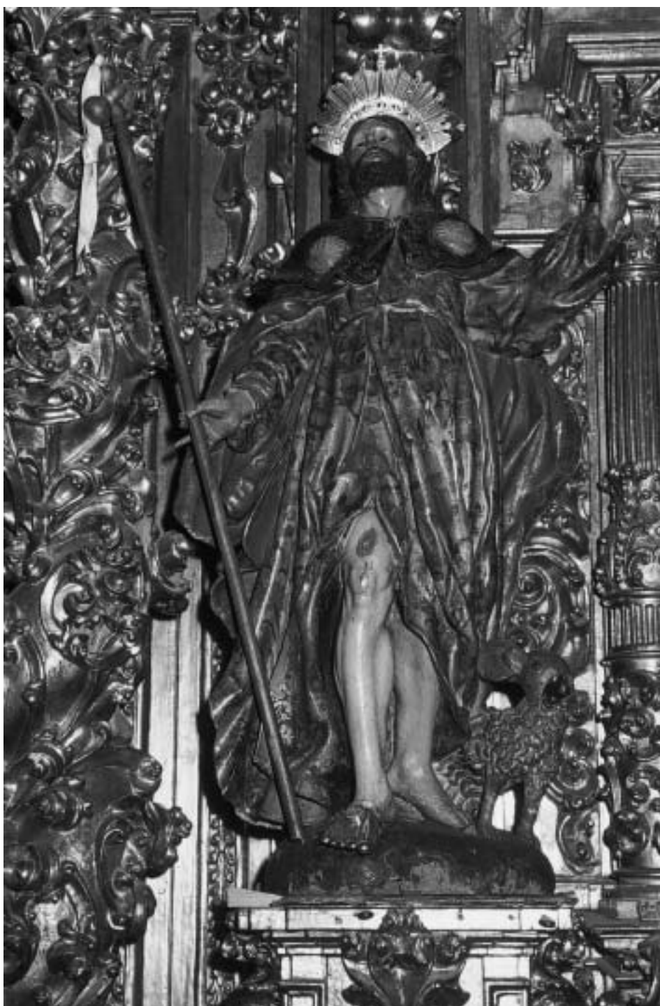
San Roque, decorada por Gerónimo de Coll en 1735