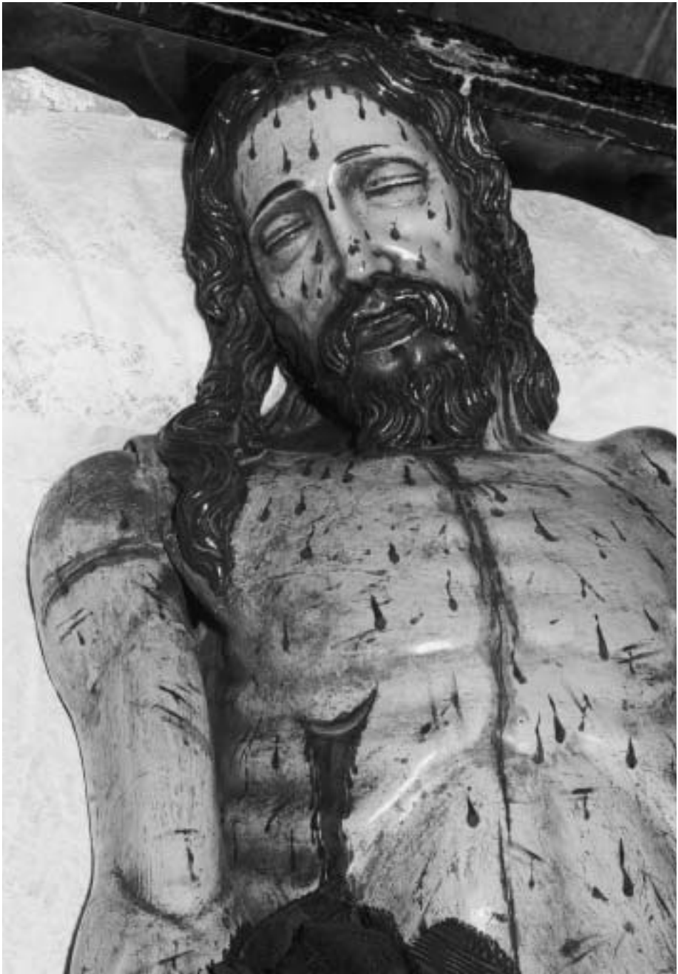
Detalle del Cristo Yacente, por Ambrosio Calvo. Año 1692