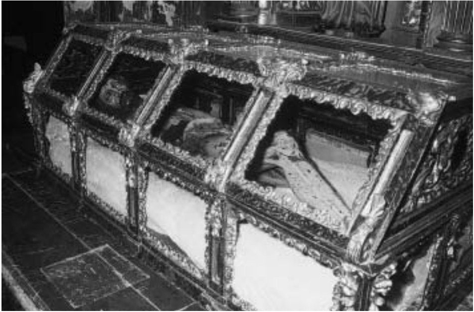
Urna del Cristo Yacente, por Francisco Javier de Coll. Año 1764