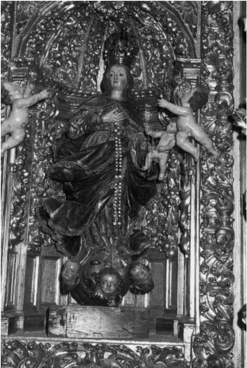
La Inmaculada Concepción, por Domingo Antonio de Elcaraeta. Año 1720