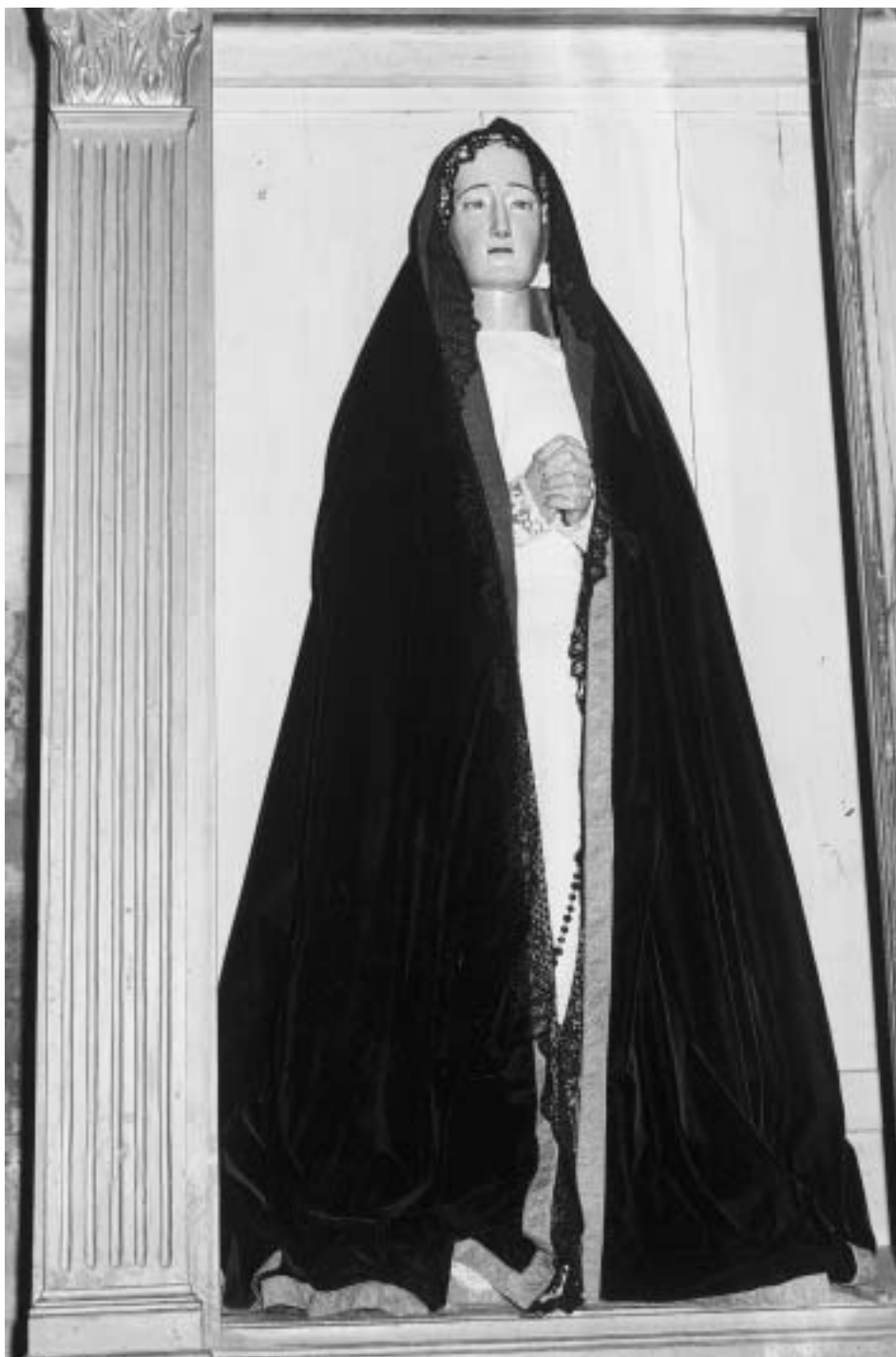
Dolorosa, por Ambrosio Calvo. Año 1692