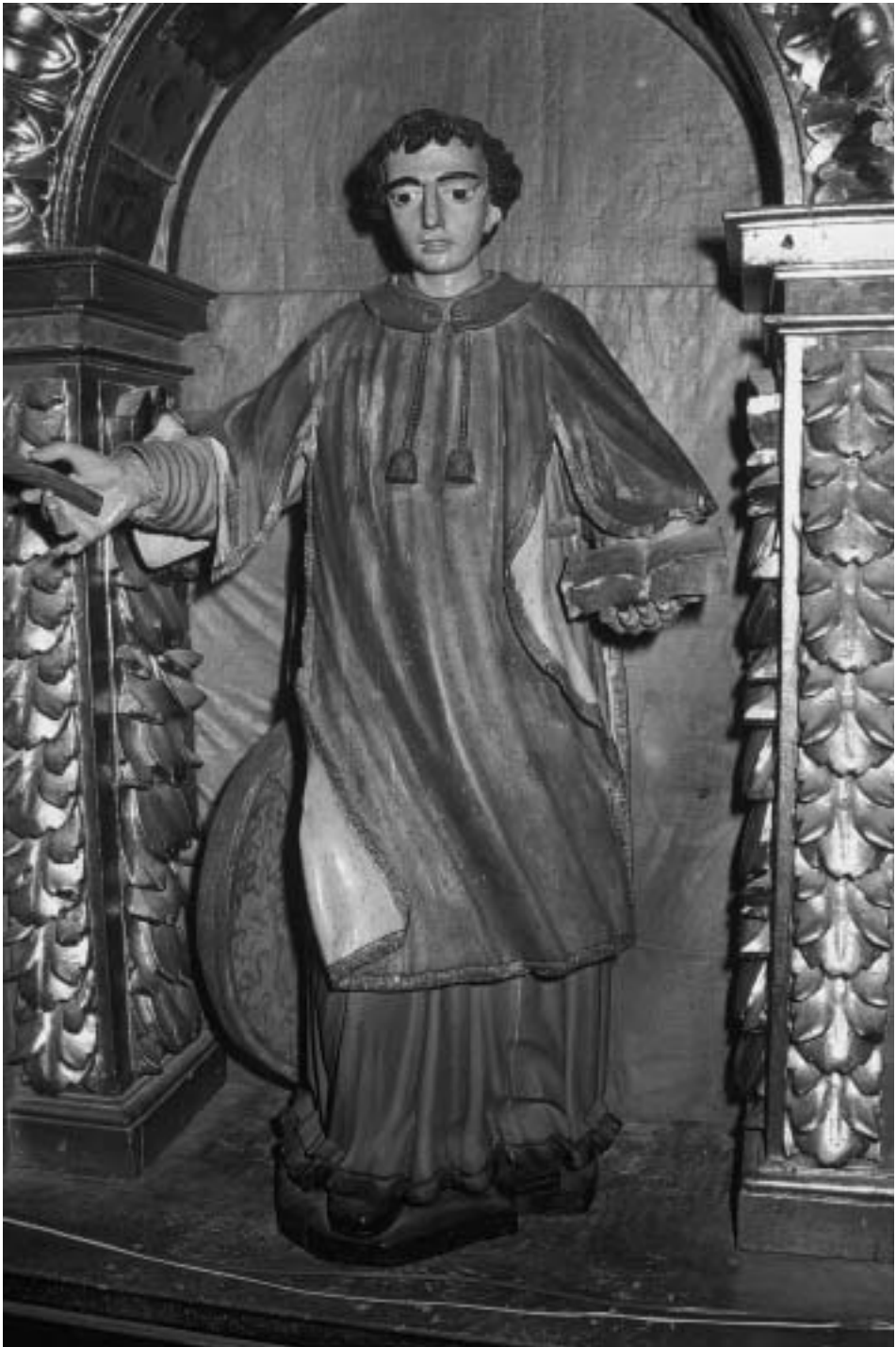
San Vicente. Escuela de Cabredo. Siglo XVII