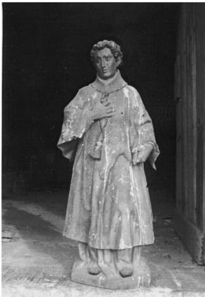
San Lorenzo, por Pedro Ximénez. Año 1630