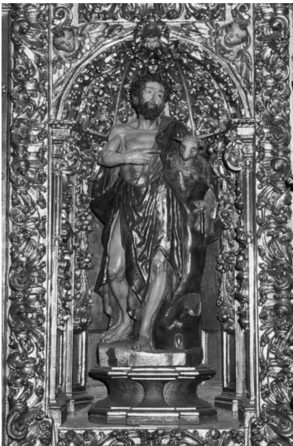
San Juan Bautista, por Pedro Ximénez. Año 1625