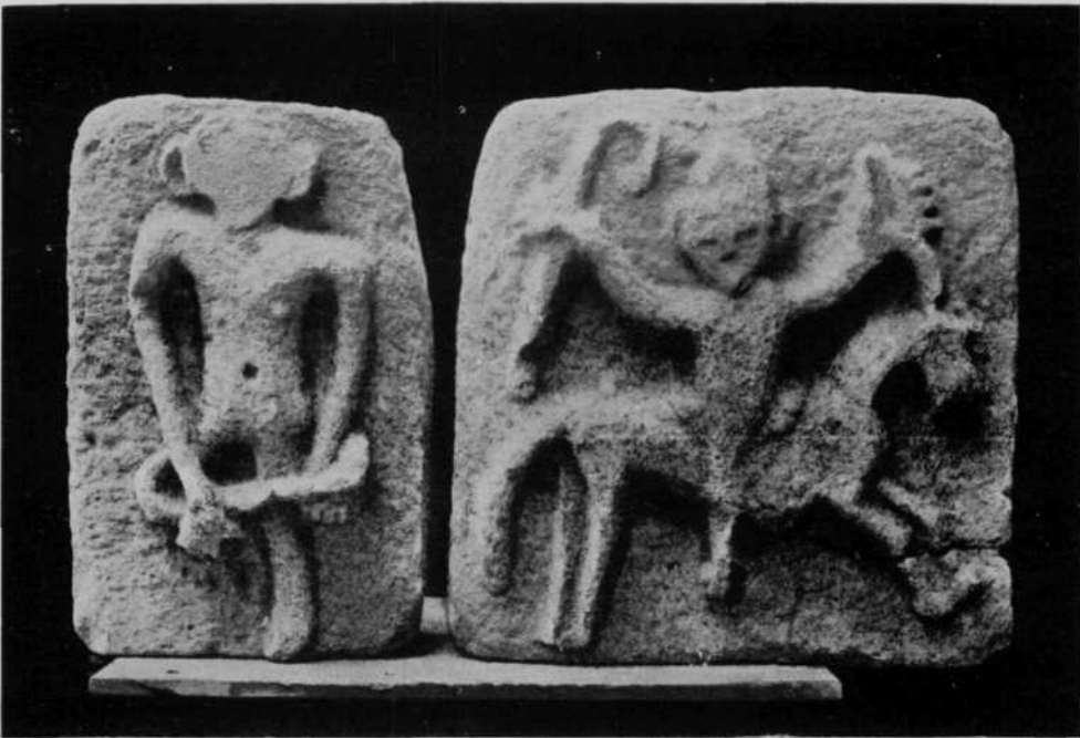
Ermita de S. Miguel de Villatuerta—Relieves