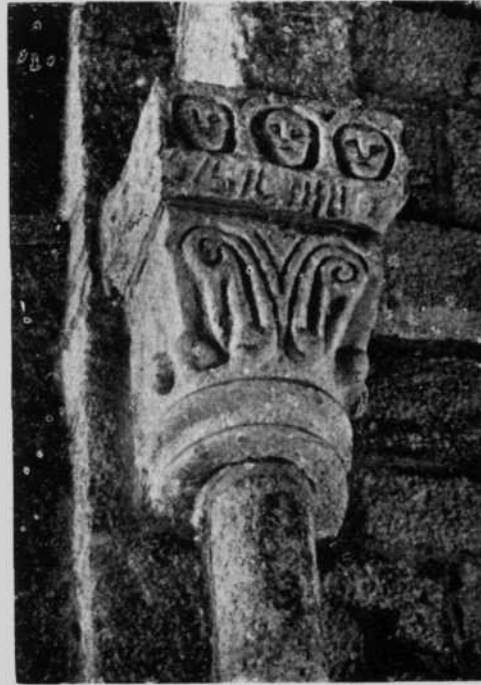
Ermita de San Miguel de Villatuerta

1.º Lápida —2º Relieve —3.º Monasterio de Leire. Capitel de la Iglesia