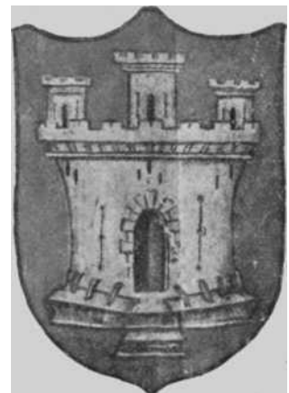
Fig. 10—Tabla pintada en 1582 para el presbiterio de Santa María.