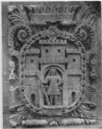
Fig. 6 — Escudo mural de la antigua Casa municipal.