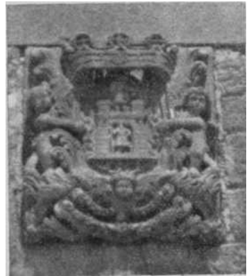
Fig. 7—Escudo mural en la fachada de Capuchinos.