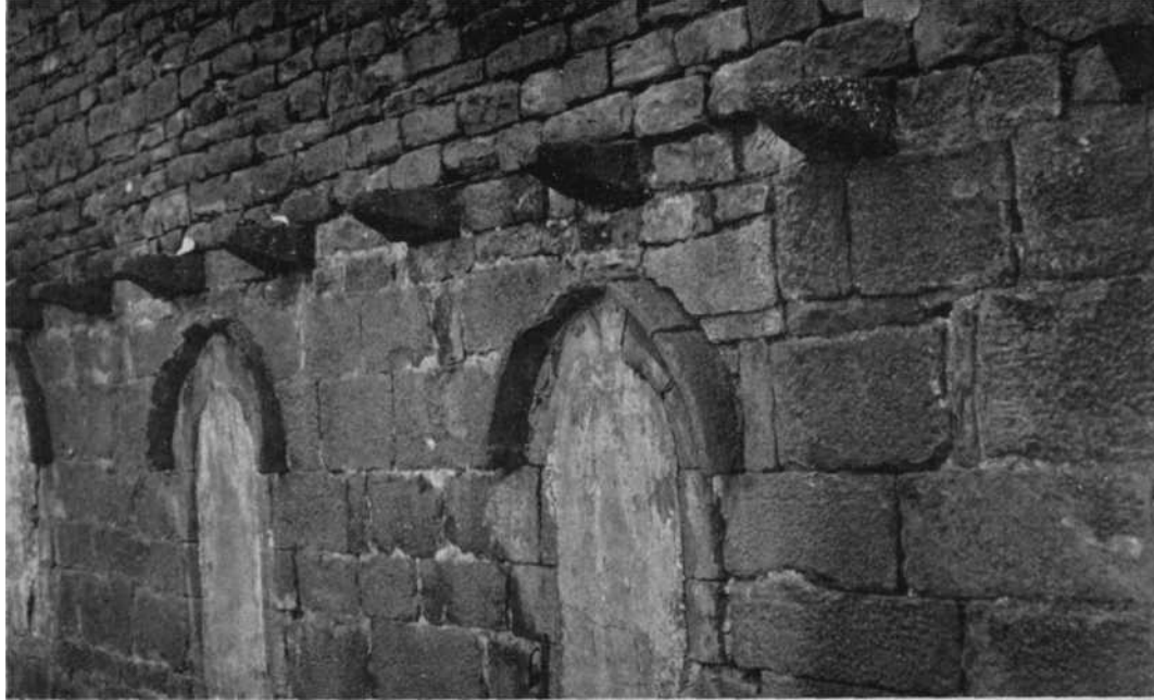
Fig. 2 — Palacio de Sosierra. Exterior de la capilla de San Nicolás donde se acusan las puntas de diamante o merlón , procedentes de las almenas del primitivo castillo.