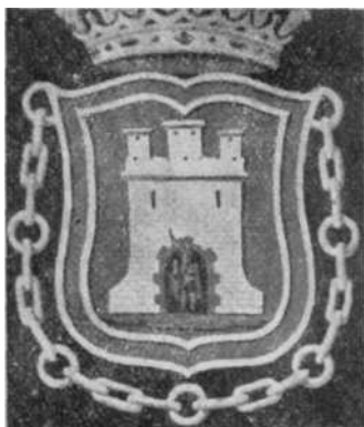
Fig 9—Escudo del salón de sesiones.