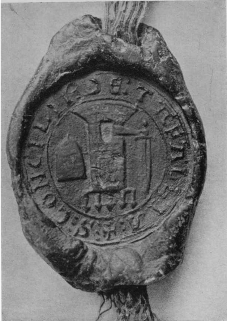
Fig. 1—Sello céreo pendiente en un documento de arbitraje entre Tafalla y Olite: 1253.