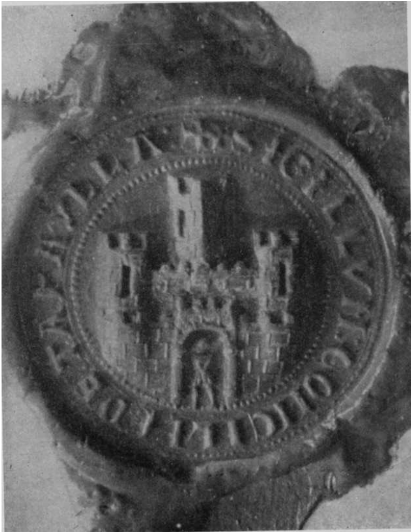
Fig. 3—Sello céreo pendiente de las ordenanzas del Concejo de Tafalla: 1309.