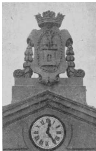
Fig. 8 —Escudo en el frontispicio de la Casa consistorial. 1857