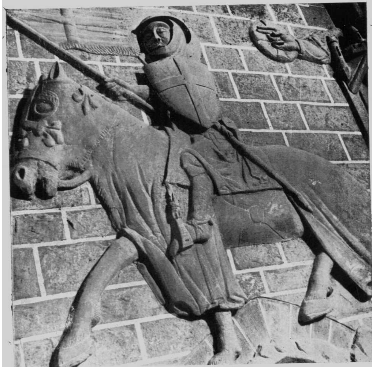
Imagen de Caballeros.