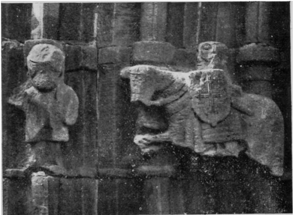
Detalle de los capiteles de la puerta de la Iglesia Parroquial de Larrangoz (Valle de Longuida).