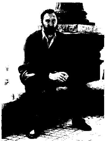
Imprime: GARRASI S.A.L.