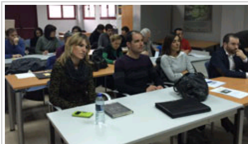
Asistentes al seminario celebrado en Arbizu.

El trabajo de campo ha analizado la situación de los 23 polígonos industriales, ubicados en diez municipios, para conocer su estado, lo que permitirá priorizar la planificación de la inversión y la estrategia para su mantenimiento. Según el informe de campo, además de las mencionadas anteriormente, otras problemáticas que afectan a los polígonos son la falta de alumbrado, deterioro de la pavimentación, problemas en la red de saneamiento y otros referidos a dificultades en el control de las licencias de actividad de las empresas.