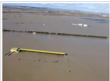
Vista aérea de una de las zonas inundadas.