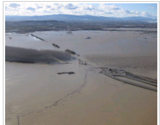
La rotonda de acceso a la Autopista A-15, rodeada de agua.