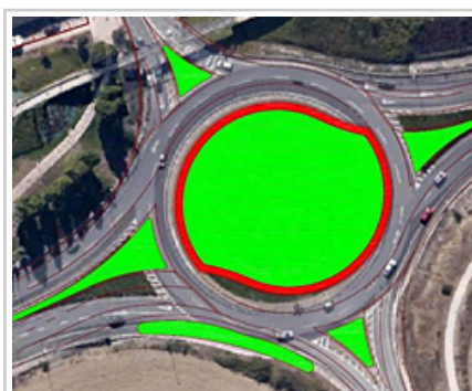
Antsoaingo hiriguneko biribilgune berriko planoak.