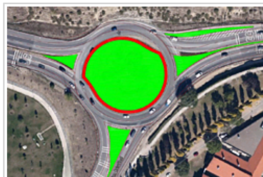
Txantreako biribilgune berriaren berregitea.

Berriozarko lotuneko itogina kentzeak inguruko trafikoa aldatuko du, eta arazo zati bat alboko beste lotune batzuetara pasa ahalko da: altxatutako glorieta eliptikora sartzeko adarrean, biribilgunera sartzeko errei labur bat erantsiz konponduko dena; edo Artiberriko glorieta, espiral formako beste glorieta batean bihur zitekeena aldaketa txiki batekin, edo zati batean semaforoak jarri ahalko ziren gurutze formako elkargune berriarekin koordinatuta.