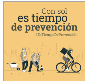
Campaña "Con sol es tiempo de prevención" INSST

Nafarroako Osasun Publikoaren eta Lan Osasunaren Institutuak (NOPLOI) ez du bere gain hartzen argitaraturiko artikuluen eta albisteen edukirik; izan ere, bere horretan hartu dira kasuan kasuan aipaturiko webgunetik, eta ez zaie aldaketarik egin ezta deus erantsi ere. Edozein kontsulta edo iradokizun egin nahi baduzu, edo ez baduzu bidaltzaile honen informazio gehiago jaso nahi, NOPLOIra jo dezakezu, helbide elektronikoa honetara ispln.ufi@navarra.es