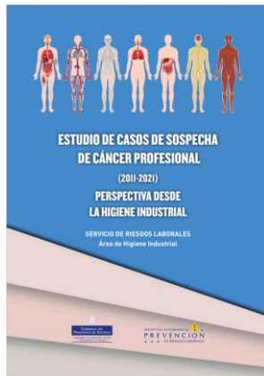
Estudio de casos de sospecha de cáncer profesional (2011-2021) IAPRL