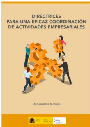
Directrices para una eficaz coordinación de actividades empresariales INSST