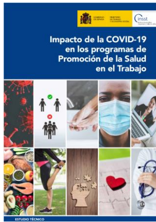
Impacto de la COVID-19 en los programas de Promoción de la Salud en el Trabajo INSST