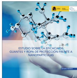
Estudio sobre la eficacia de guantes y ropa de protección frente a nanopartículas INSST