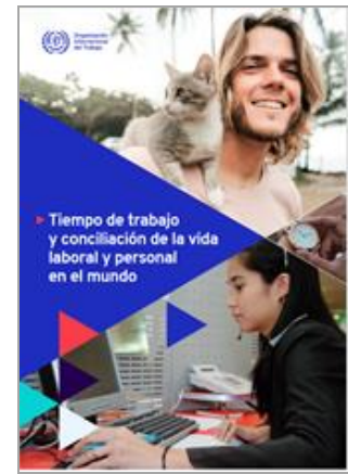
Tiempo de trabajo y conciliación de la vida laboral y personal en el mundo OIT