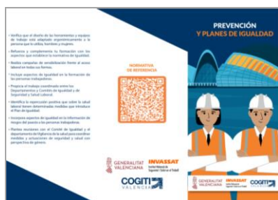
Prevención y Planes de Igualdad INVASSAT/ COGITI Valencia