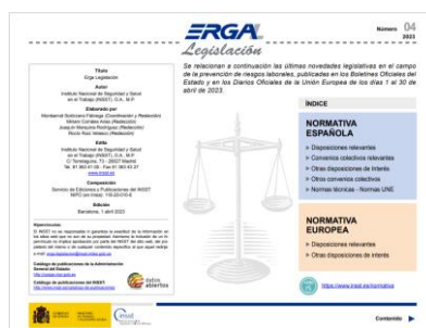
ERGA - Legislación Nº 4 - 2023

Nafarroako Osasun Publikoaren eta Lan Osasunaren Institutuak (NOPLOI) ez du bere gain hartzen argitaraturiko artikuluen eta albisteen edukirik; izan ere, bere horretan hartu dira kasuan kasuan aipaturiko webgunetik, eta ez zaie aldaketarik egin ezta deus erantsi ere. Edozein kontsulta edo iradokizun egin nahi baduzu, edo ez baduzu bidaltzaile honen informazio gehiago jaso nahi, NOPLOIra jo dezakezu, helbide elektronikoa honetara ispln.ufii@navarra.es