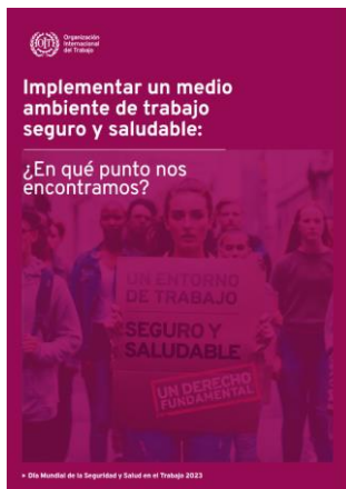
Implementar un medio ambiente de trabajo: seguro y saludable OIT