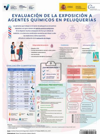
Evaluación de la exposición a agentes químicos en peluquerías INSST