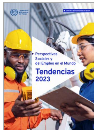
Perspectivas sociales y del empleo en el mundo – Tendencias 2023 OIT