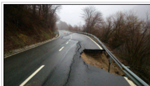
Iruña-Frantzia bidean (Luzaidetik) hondoratutako galtzadaren irudia.