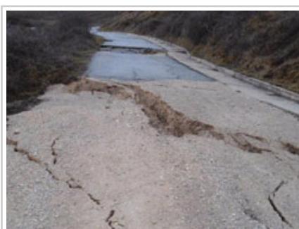
NA-5310 errepidea, Uxuen.