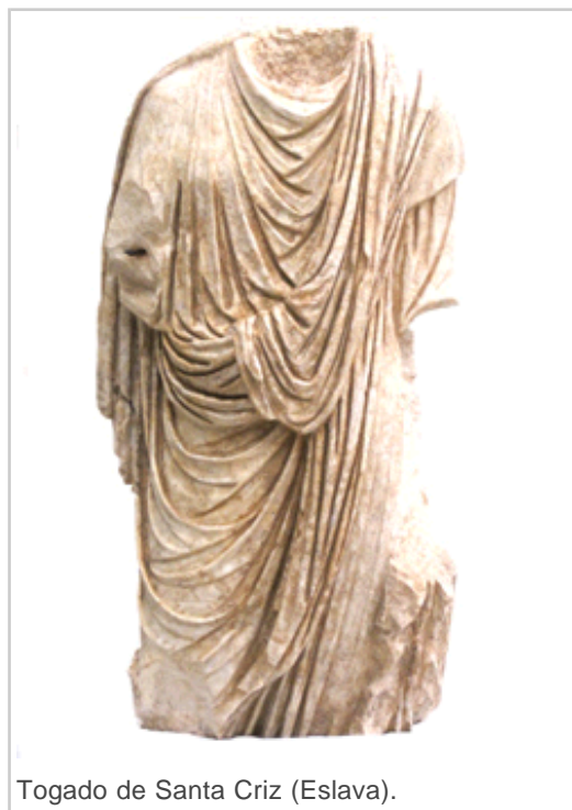
Togado de Santa Criz (Eslava).

Los materiales arqueológicos que albergan estos fondos están disponibles para la consulta por parte de investigadores e interesados. Así, durante 2013 se han registrado 43 consultas, de las cuales 4 fueron de larga duración (para tesis doctorales o proyectos de investigación de ámbito supraterritorial). También se prestan estos fondos para exposiciones temporales y quedan a disposición para la renovación de las exposiciones permanentes de los museos navarros.