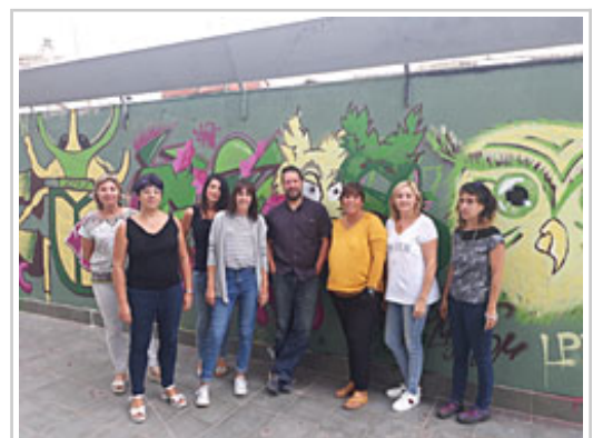
Profesionales participantes en el curso en Tafalla.

Esta formación proviene de la necesidad de trabajar con la juventud en la prevención de la violencia contra las mujeres jóvenes, promoviendo comportamientos de respeto y buen trato, ya que los datos apuntan a que siguen perviviendo comportamientos que reflejan todavía la existencia de discriminaciones y comportamientos sexistas en