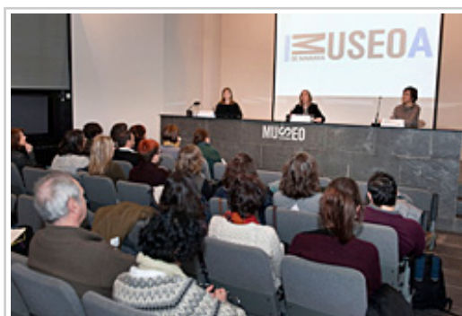
La jornada se ha celebrado en el Museo de Navarra.