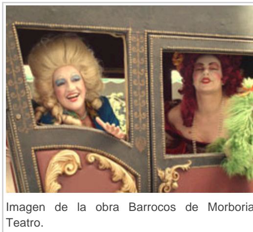
Imagen de la obra Barocos de Morboria Teatro.

"Mil siglos de amor cualquier instante" es otro de los espacios diseñados en el festival. El amor era un