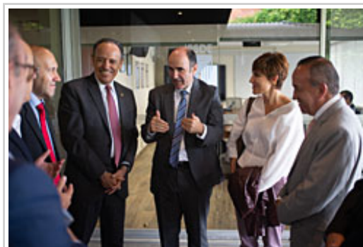
Ayerdi conversa con autoridades del Estado de Puebla.

La visita ha incluido un encuentro con una representación de personas navarras residentes en Puebla. Entre los asistentes se encontraban navarros de segunda y tercera generación, trabajadores desplazados en empresas navarras y profesionales residentes actualmente en la zona. Las empresas participantes en la misión han tenido ocasión de conocer de mano de estas personas su experiencia en México, así como las peculiaridades de la cultura y el mercado mexicano.