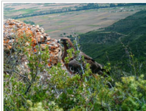
Fila txita bat zela askatu zuten jaio eta handik 50 egunetara.

Programa Europako Batzordeak kofinantzatzen du. Honako hauek parte hartzen dute: Andaluziako Junta, Arabako Foru Aldundia, Madrilgo Erkidegoa, Balearretako Gobernua Consorci per la Recuperació de la fauna de les Illes Balears-en bitartez, Fundació Natura Parc, Nafarroako Gobernua Nafarroako Ingurumen Kudeaketa enpresa publikoaren bidez, eta ondorengo GKEek: Bertako Fauna eta Habitata Birgaitzeko Taldea eta la Ligue pour la Protection des Oiseaux, BirdLife International-en Frantziako ordezkaria.